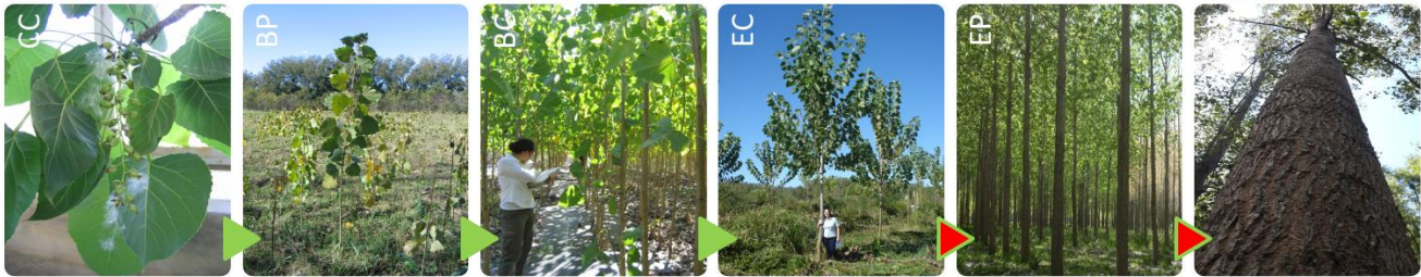
Figura 1: Etapas del programa de mejoramiento de álamo de INTA. De izq. a der.: Cruzamientos Controlados (CC), Banco de Progenie (BP), Banco Clonal (BC), Ensayos Comparativos (EC), Ensayos de Productividad (EP) y Clon Selecto (CS).

Un detalle del progreso del programa puede verse en la siguiente figura (Figura 1):