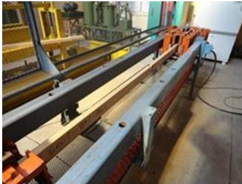
Figura 3: Configuración de ensayos. Sup: compresión paralela. Inf: Tracción paralela

Los ensayos de compresión paralela fueron realizados de acuerdo a NCh 3028/1[7] en una máquina de ensayo con un marco de carga/reacción de compresión diseñado para una capacidad de 400 kN, con un cilindro hidráulico marca Enerpac de 300 kN de capacidad. La adquisición de datos se realizó en forma digital directa a PC mediante un transductor de presión continua con frecuencias superiores a 100 datos por segundo. Para cada pieza fue determinada la tensión de rotura de compresión ( f_{c,0} ) de acuerdo a: