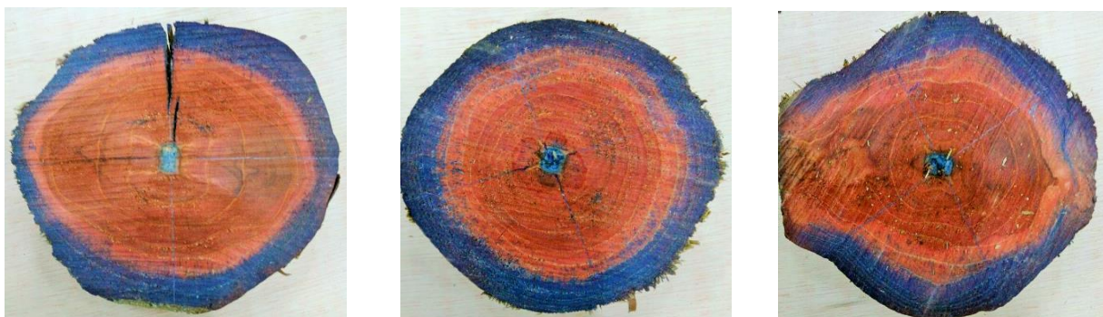
Figura 4: Disco com presença de cromoazurol para avaliação qualitativa

Na Tabela 4 são descritas a avaliação da penetração qualitativa e quantitativa para o alburno, cerne e medula e a análise de retenção com CCA, para cada peça de madeira tratada.