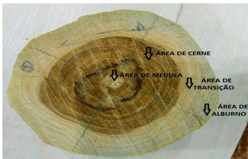
Figura 2: As setas indicam as áreas identificadas na madeira de teca

A quantidade de cerne é inversamente proporcional à quantidade de alburno. O valor da porcentagem de cerne foi menor que o verificado por Flórez (2012) que encontrou uma porcentagem de cerne de 51,44% para árvores com mesma idade. Essa diferença se deve provavelmente pelo fato de que o material do presente trabalho foi coletado em porções mais altas da árvore, cujo diâmetro foi inferior a 15 cm. Flórez (2012) coletou amostras ao longo do tronco e a porcentagem de cerne dada pelo autor é o valor médio para a árvore toda.